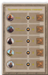
Планшет споганення суверенів