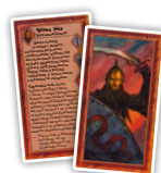
Тінь (3) Карти темних ватажків