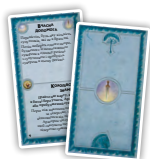
Вільні Народи (10)