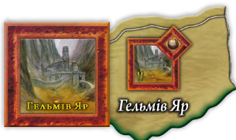
Гельмів Яр Плитки фортець Тіні