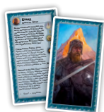
Вільні Народи (5) Карти пробуджених суверенів