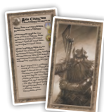
Вільні Народи (5) Карти споганених суверенів