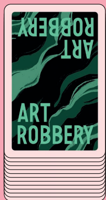
Колода запасу, долілиць