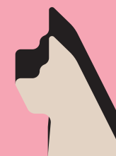
Фігурка сторожового пса

Довкола 3-го раунду точаться дискусії. У поточній версії 3-ге пограбування містить 2 фішки «наглядачки» та жодної фішки із цифрою 5. Спершу ми грали так, ця асиметрія додає грі шарму. Але схоже, що це — помилка видавця, і в цьому пограбуванні теж мала бути 1 «п'ятірка» і 1 «наглядачка». Нам подобаються обидва варіанти — тож рекомендуємо вам спробувати грати і з однією «наглядачкою», і з двома.