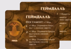
1 ДВОСТОРОННЯ КАРТА БОГА ГЕЙМДААЛЯ