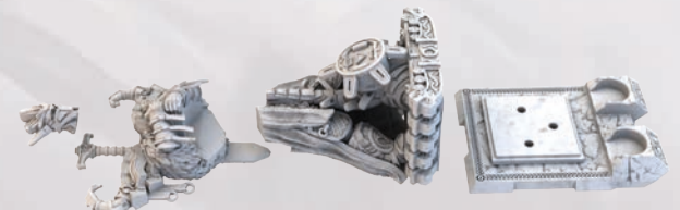
МОНУМЕНТ ГЕЙМДААЛЯ (РОЗІБРАНИЙ)