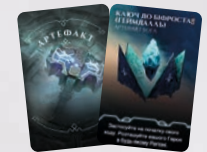
КАРТА АРТЕФАКТУ БОГА ГЕЙМДААЛЯ