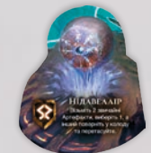
ЖЕТОН ЦАРСТВА НІДАВЕЛЛІР