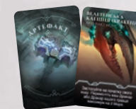
КАРТА АРТЕФАКТУ КРАКЕНА