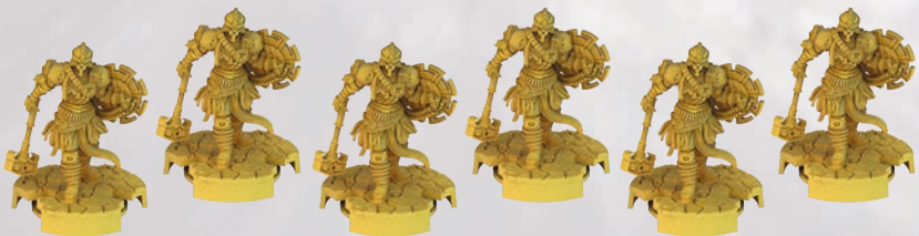
6 МІНІАТЮР АРМІЙ