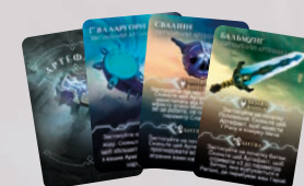
8 КАРТ ЗВИЧАЙНИХ АРТЕФАКТІВ