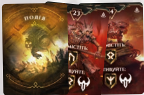
3 КАРТИ ПОДІЙ