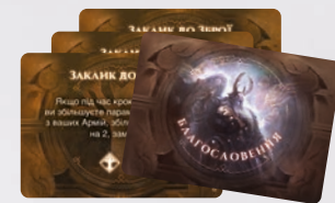
12 КАРТ БЛАГОСЛОВЕНЬ ГЕЙМДААЛЯ