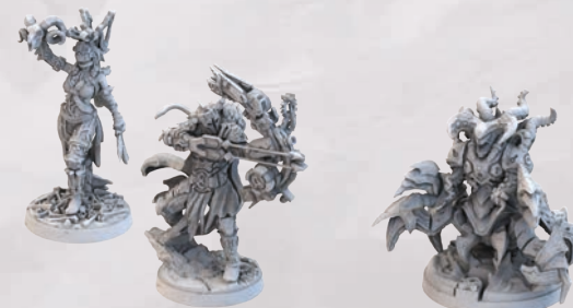
2 МІНІАТЮРИ ГЕРОЇВ МІНІАТЮРА КРАКЕНА