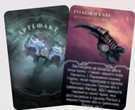
КАРТА АРТЕФАКТУ БОГІНІ ГЕЛЬ