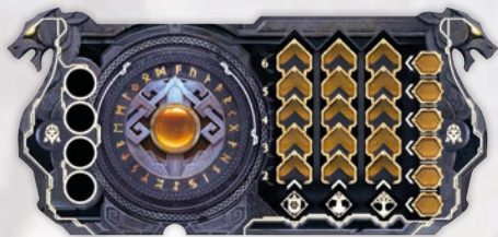
1 ПЛАНШЕТ ГРАВЦЯ