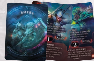
35 КАРТ БИТВИ