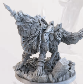
МІНІАТЮРА БОСА ФЕНРІРА