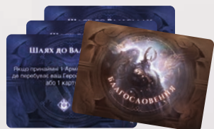
12 КАРТ БЛАГОСЛОВЕНЬ ГЕЛЬ