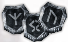
3 ЖЕТОНИ КУЗНІ