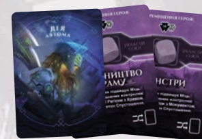
4 КАРТИ ДІЇ (СОЛО-ГРА)