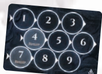
1 ТРЕК ХРАМУ