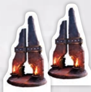
2 ХРАМИ (ТА ПЛАСТИКОВІ ОСНОВИ)