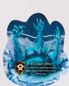
ЖЕТОН ЦАРСТВА ГЕЛЬГЕЙМ