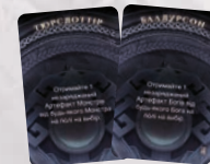
2 КАРТИ ПОХОДЖЕННЯ