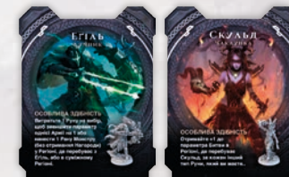
2 ПЛИТКИ ГЕРОЇВ