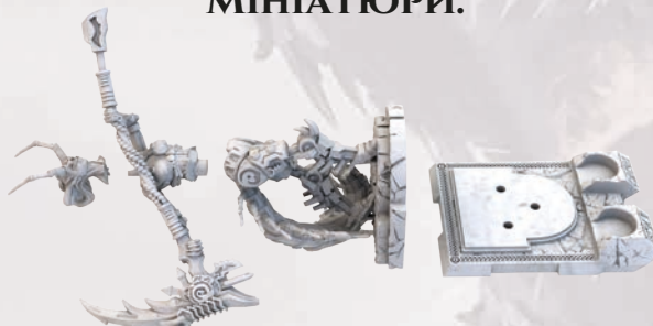
МОНУМЕНТ ГЕЛЬ (РОЗІБРАНИЙ)