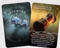
КАРТА АРТЕФАКТУ ЙОРМУНГАНДА