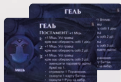
1 ДВОСТОРОННЯ КАРТА БОГІНІ ГЕЛЬ