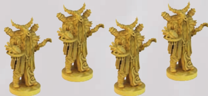
4 МІНІАТЮРИ ЖЕРЦІВ