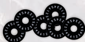
6 ШКАЛ ДЛЯ АРМІЙ