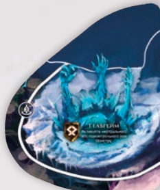
ЖЕТОН ЦАРСТВА ГЕЛЬГЕЙМ ДЛЯ 2 ГРАВЦІВ