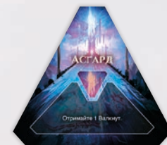
ЖЕТОН ЦАРСТВА АСГАРД