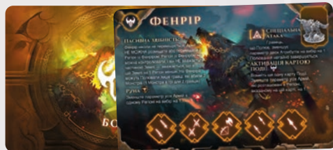
ПЛАНШЕТ БОСА ФЕНРІРА