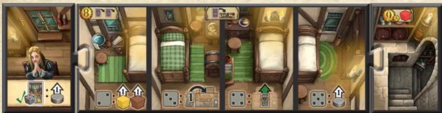
Модуль А (винний погріб)