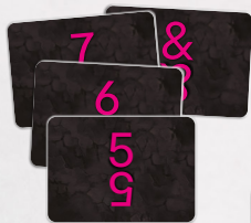
Зворот карт випробувань