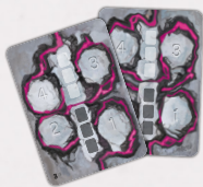
2 карти черговості ходів