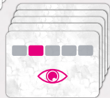
Карти планів захоплення