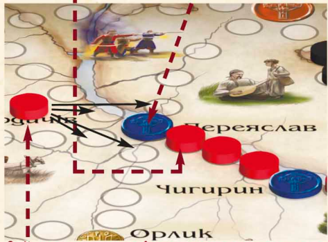
3-й отаман, оскільки гетьман не вказав, куди рухатися після Переяслава, має можливість викласти свою фішку походів шляхом на Новгород-Сіверський, Овруч, Бердичів чи Орлик

2-й отаман виклав фішку походів безпосередньо на Переяслав, а гетьман замінив її своєю печаткою