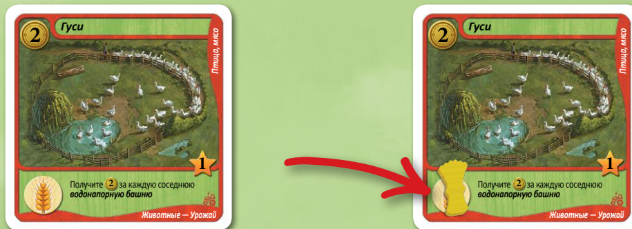
Выплата стоимости свойства

Выплачивать стоимость урожайных свойств (и применять их) можно в любом порядке. Делая это, кладите требуемые ресурсы на стоимость свойств в качестве напоминания об уплате.